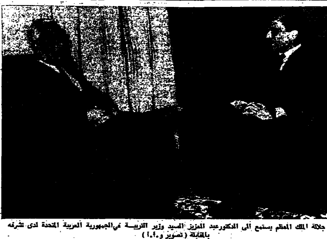
جلالة الملك اعظم يستمع الى الدكتور عبد العزيز السيد وزير التربية في الجمهورية العربية المتحدة لدى تشرته بالقبلة

٣- يدعو المؤتمر الحكومة الأردنية ان تبادر الى دعوة مجلس الجامعة العربية للتعرف في عمان في اقرب وقت البقية على الصفحة الخامسة عمود ١ هزات وفيضانات تجتاح ايران طهران - رويتر - فكر ان فيضانات مفاجئة ناجمة عن امطار غزيرة تسد اجنحت عشرة اشخاص في كلفان في جنوب ايران ودمرت عددا من القلر وقتلت جموعا من المواشي . واضطرت الابناء من هزات ارضية ضربت كوشان في شمال شرق ايران ومكرو في شمال غرب البلاد دون ان تقع اصابات .